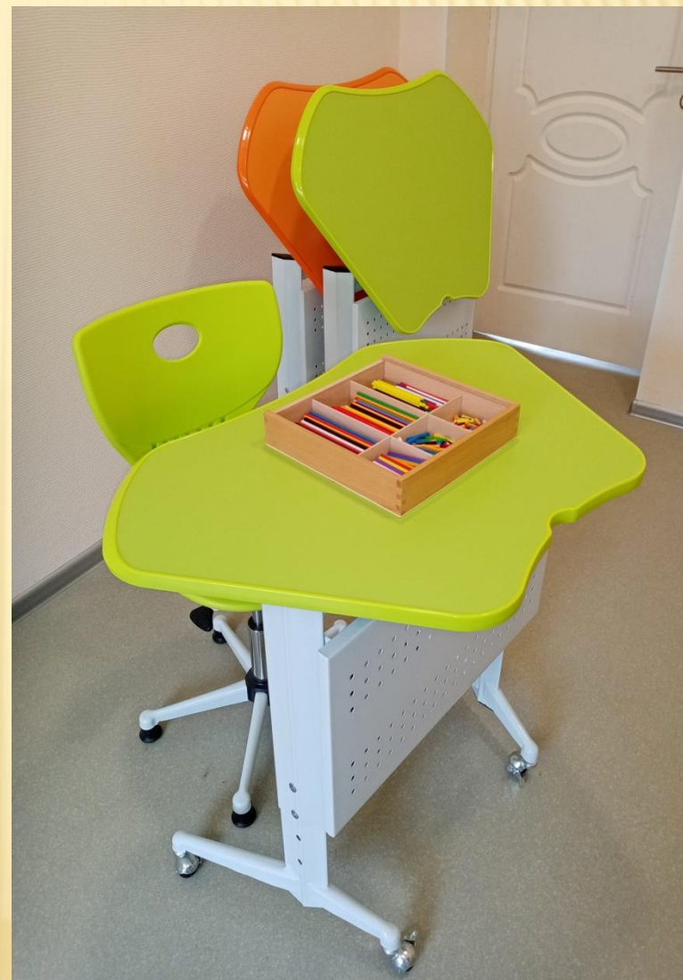
Индивидуальная форма работы