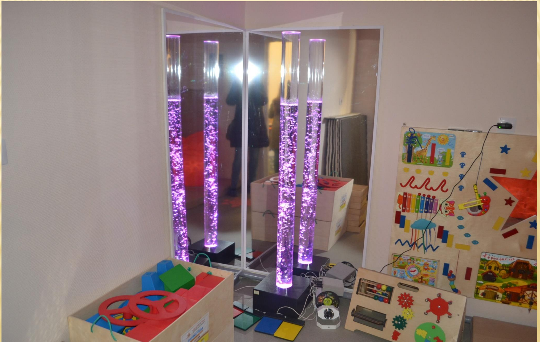
Детский зеркальный уголок с пузырьковой колонной