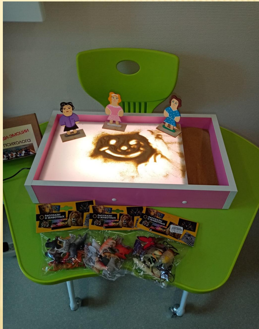
Световые планшеты для рисования песком