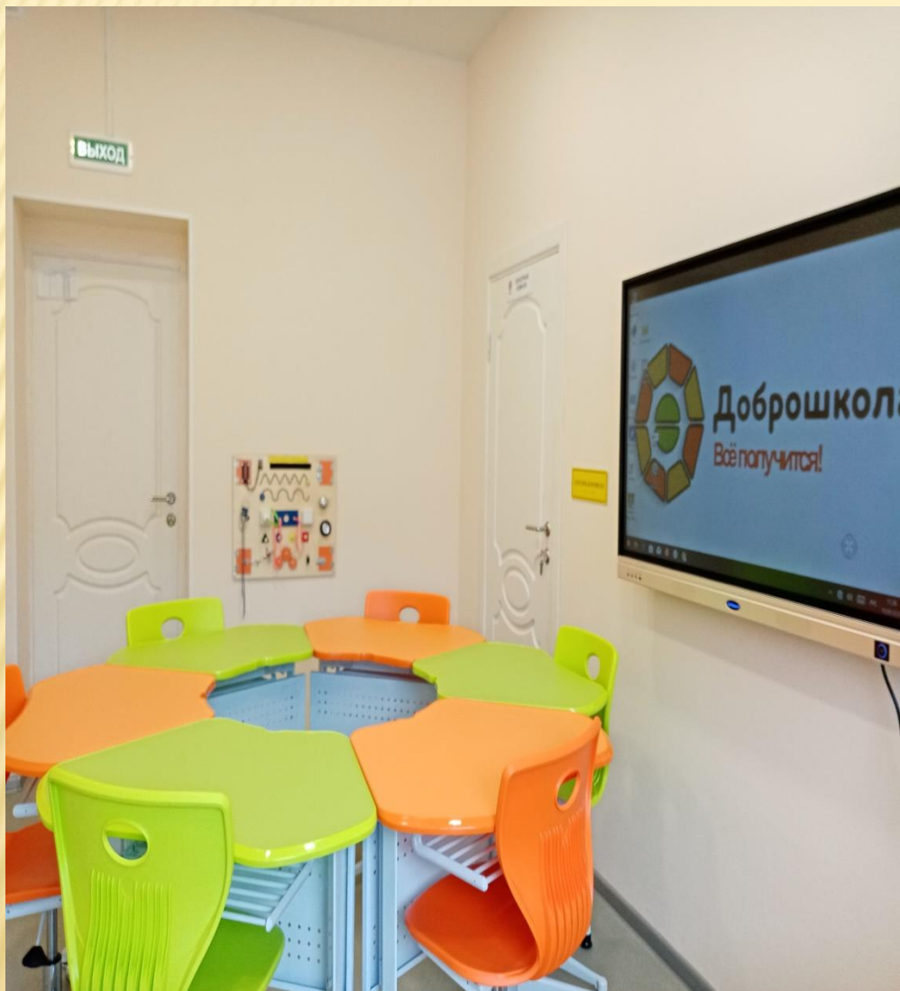
Групповая форма работы