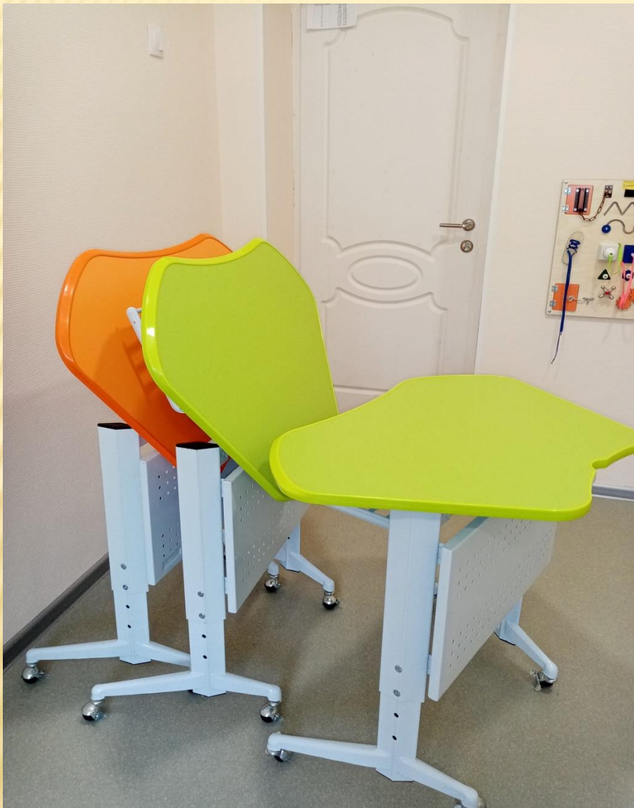
Одноместные ученические столы