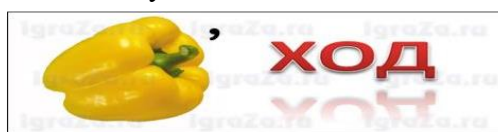
Ребус для команды №4