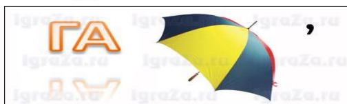
Ребус для команды №3